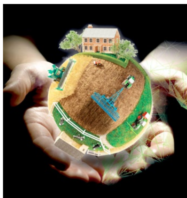
NEXT Farming macht die landwirtschaftliche Welt leichter – heute und morgen

Modernste Technologie bringt diese Daten aus dem Büro direkt auf den Acker, wo die Maschine ebenfalls automatisiert arbeitet. NEXT Machine Management bietet drahtlose Kommunikation in Echtzeit. Düngerstreuer bringen so den Dünger optimal verteilt aus, Sämaschinen legen das Saatgut in berechneter Stärke ab – und jede Pflanze erhält den perfekten Start. Mit diesen Smart-Farming-Verfahren werden durch effizienteren Einsatz der Ressourcen und Steigerung des Ertrags bis zu 20 Prozent bessere Ergebnisse erreicht. Landwirtschaft ist eben eine echte Zukunftsbranche.